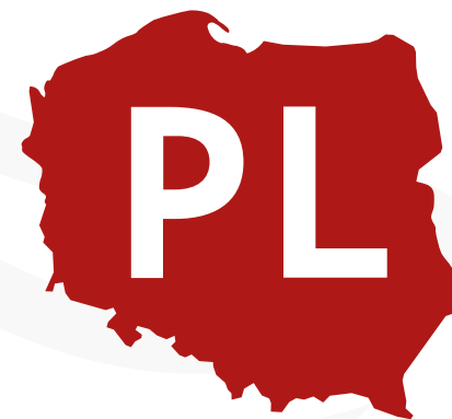
UPROSZCZONY ZARYS MAPY POLSKI - STOSOWANY JAKO FAVICON WWW

Logo składa się z sygnetu uproszczonej mapy Polski w kolorze czerwonym, z naniesionymi literami PL w kolorze białym, wraz z dopiskiem „ START ” w kolorze czarnym (czcionka Brother 1816). Znak może występować w wersji z dopiskiem „ AKCELERATOR BIZNESU ” lub bez niego.